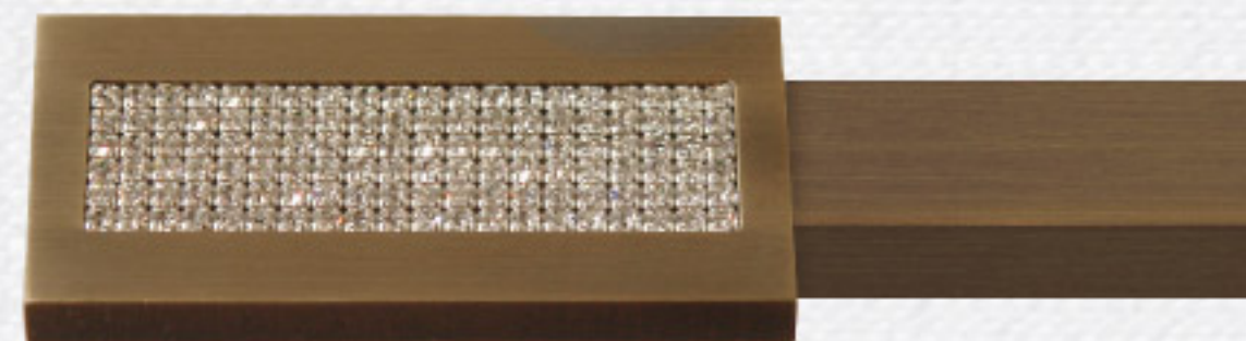
Aufsatz aufgesetztes Rechteck