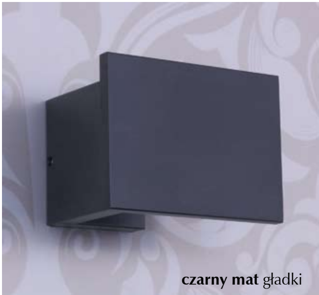
czarny mat gładki