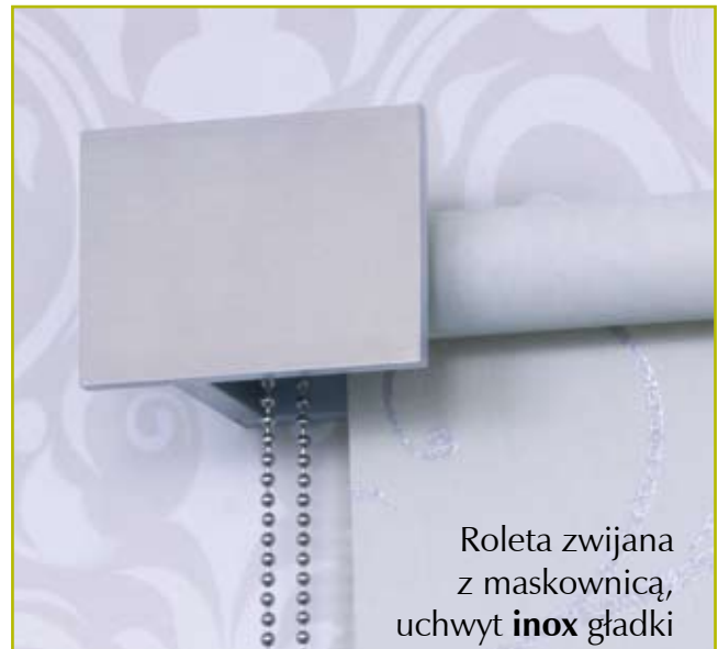
Roleta zwijana z maskownicą, uchwyt inox gładki