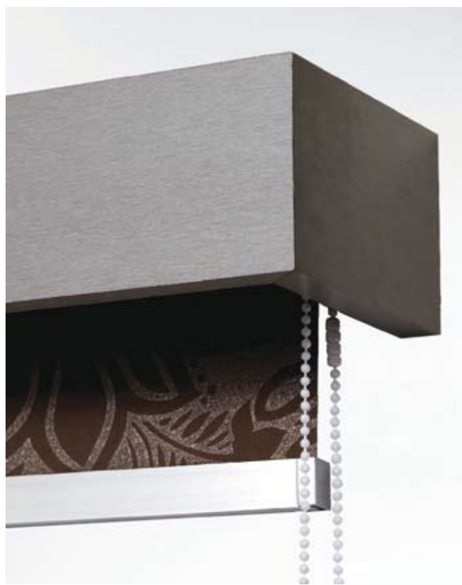
Maskownica D101 z roletą zwijaną i obciążnikiem Modern 30