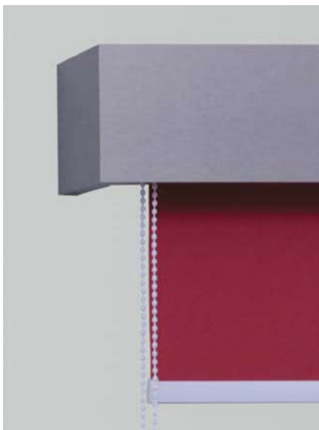
Maskownica D61 z roletą zwijaną i obciążnikiem Modern 30