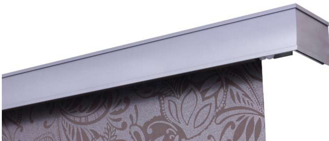
Maskownica Modern 80 z roletą zwijaną