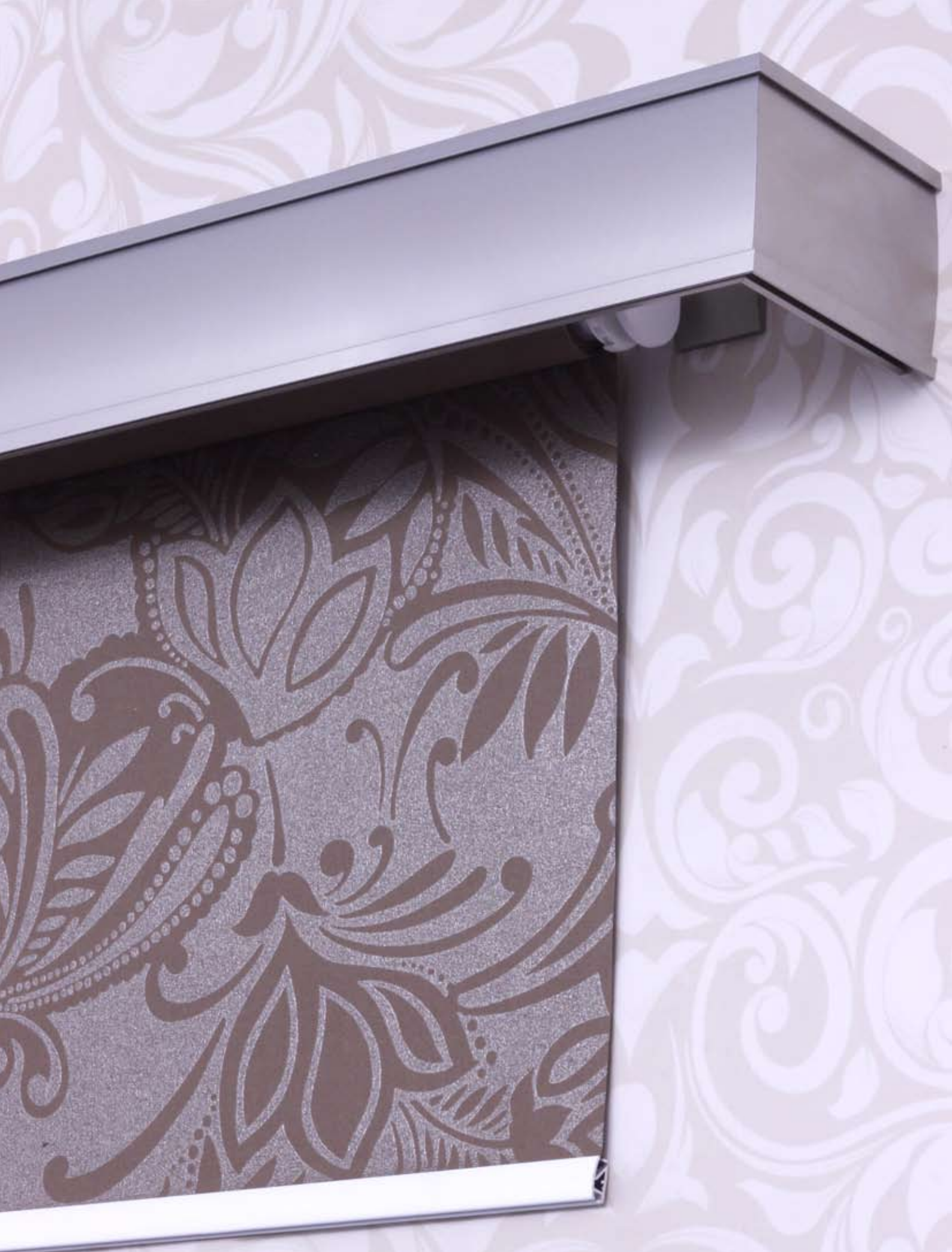
Mechanizm rolety zwijanej zamontowany do profilu Modern 80