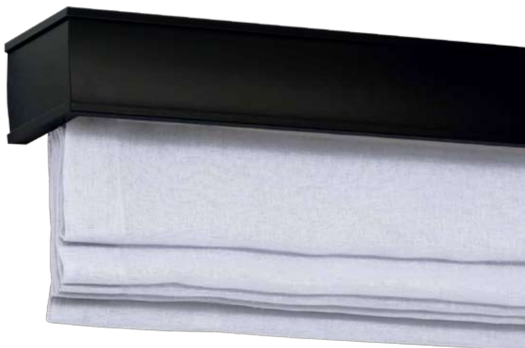
Maskownica Modern 80 z roletą rzymską